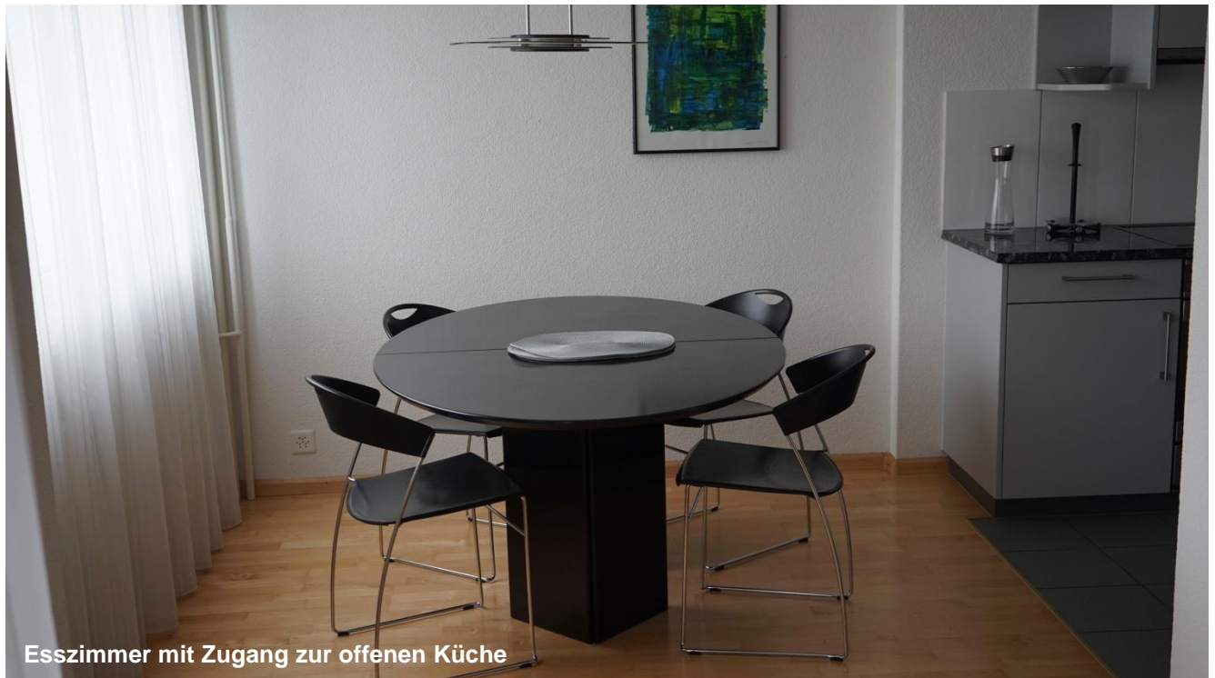
Esszimmer mit Zugang zur offenen Küche