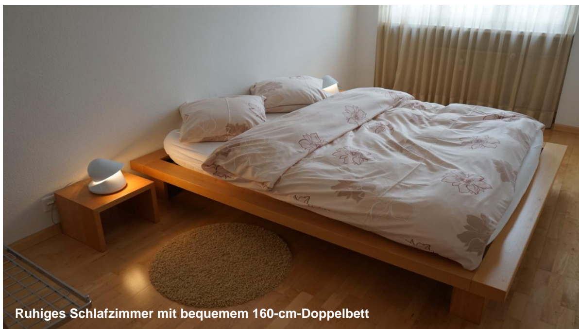
Ruhiges Schlafzimmer mit bequemem 160-cm-Doppelbett