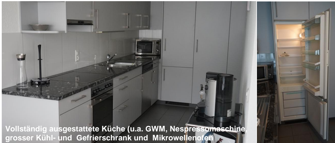
Vollständig ausgestattete Küche (u.a. GWM, Nespressomaschine, grosser Kühl- und Gefrierschrank und Mikrowellenofen)