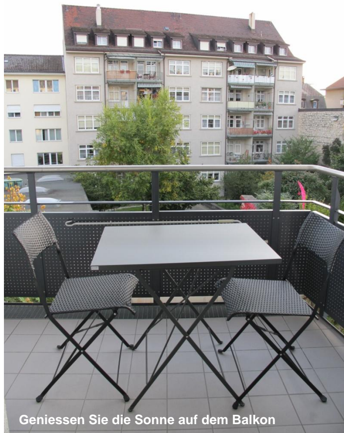
Geniessen Sie die Sonne auf dem Balkon