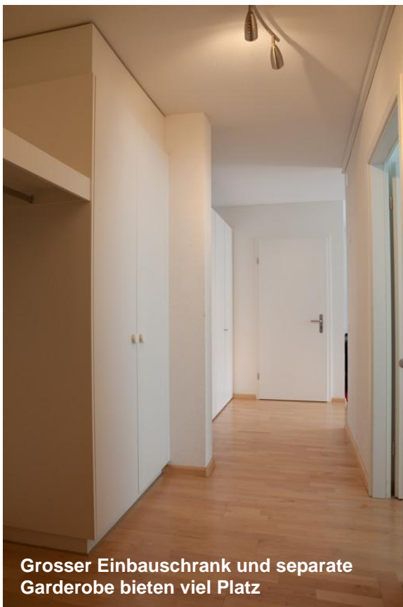
Grosser Einbauschrack und separate Garderobe bieten viel Platz