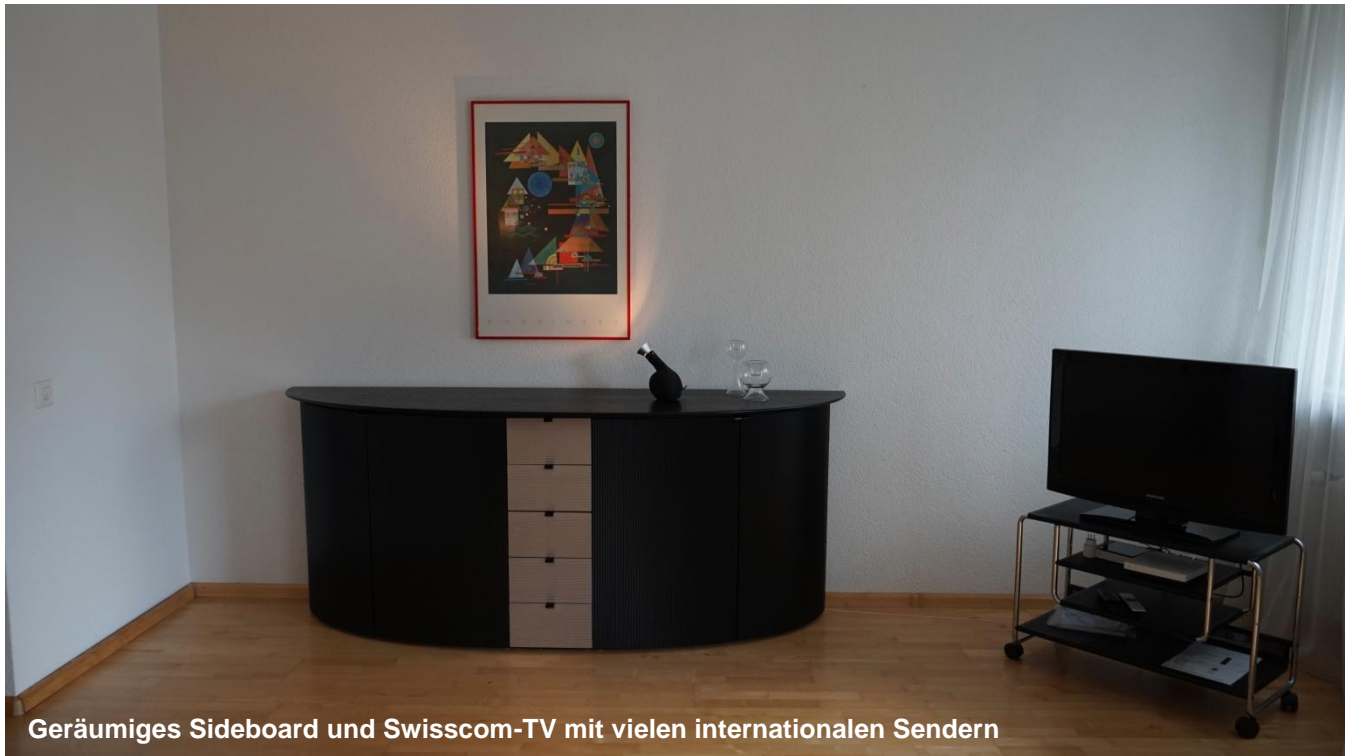
Geräumiges Sideboard und Swisscom-TV mit vielen internationalen Sendern