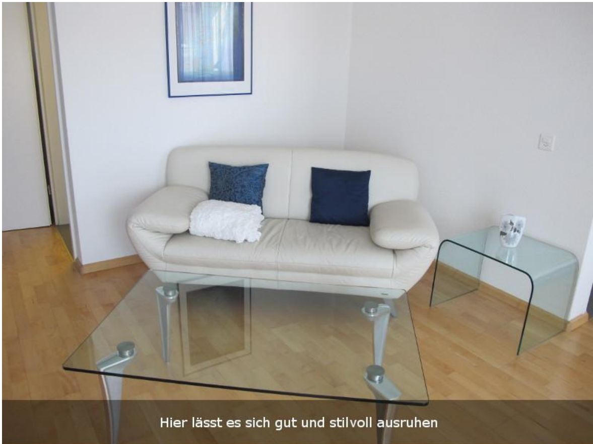
Hier lässt es sich gut und stilvoll ausruhen