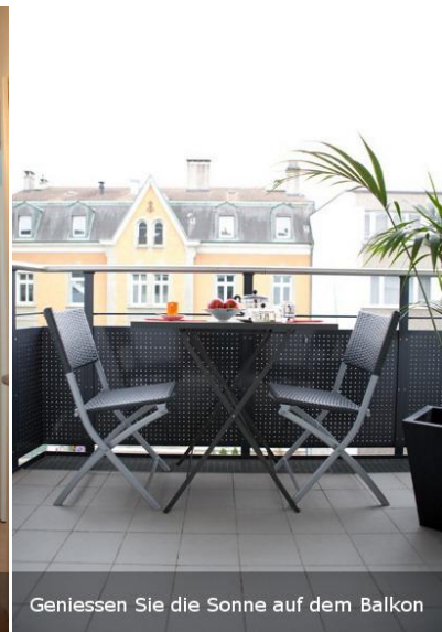
Geniessen Sie die Sonne auf dem Balkon