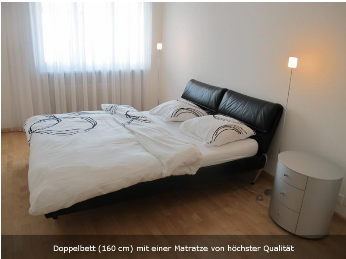
Doppelbett (160 cm) mit einer Matratze von höchster Qualität