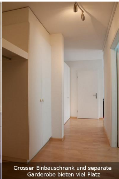
Grosser Einbauschränk und separate Garderobe bieten viel Platz