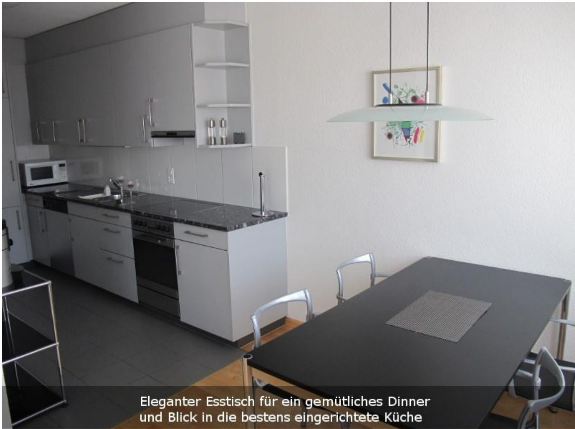
Eleganter Esstisch für ein gemütliches Dinner und Blick in die bestens eingerichtete Küche