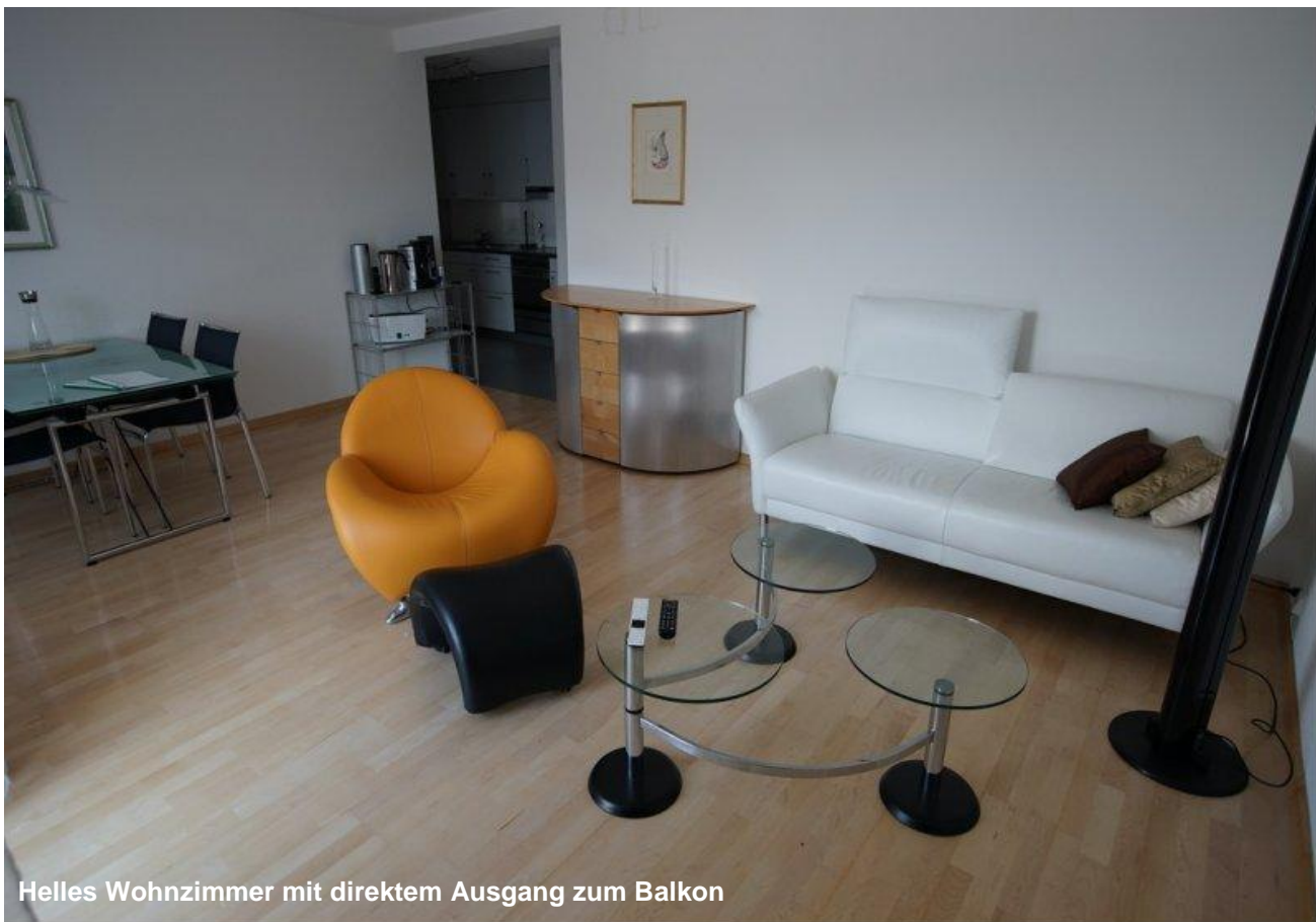
Helles Wohnzimmer mit direktem Ausgang zum Balkon