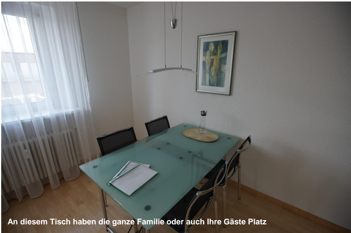
An diesem Tisch haben die ganze Familie oder auch Ihre Gäste Platz