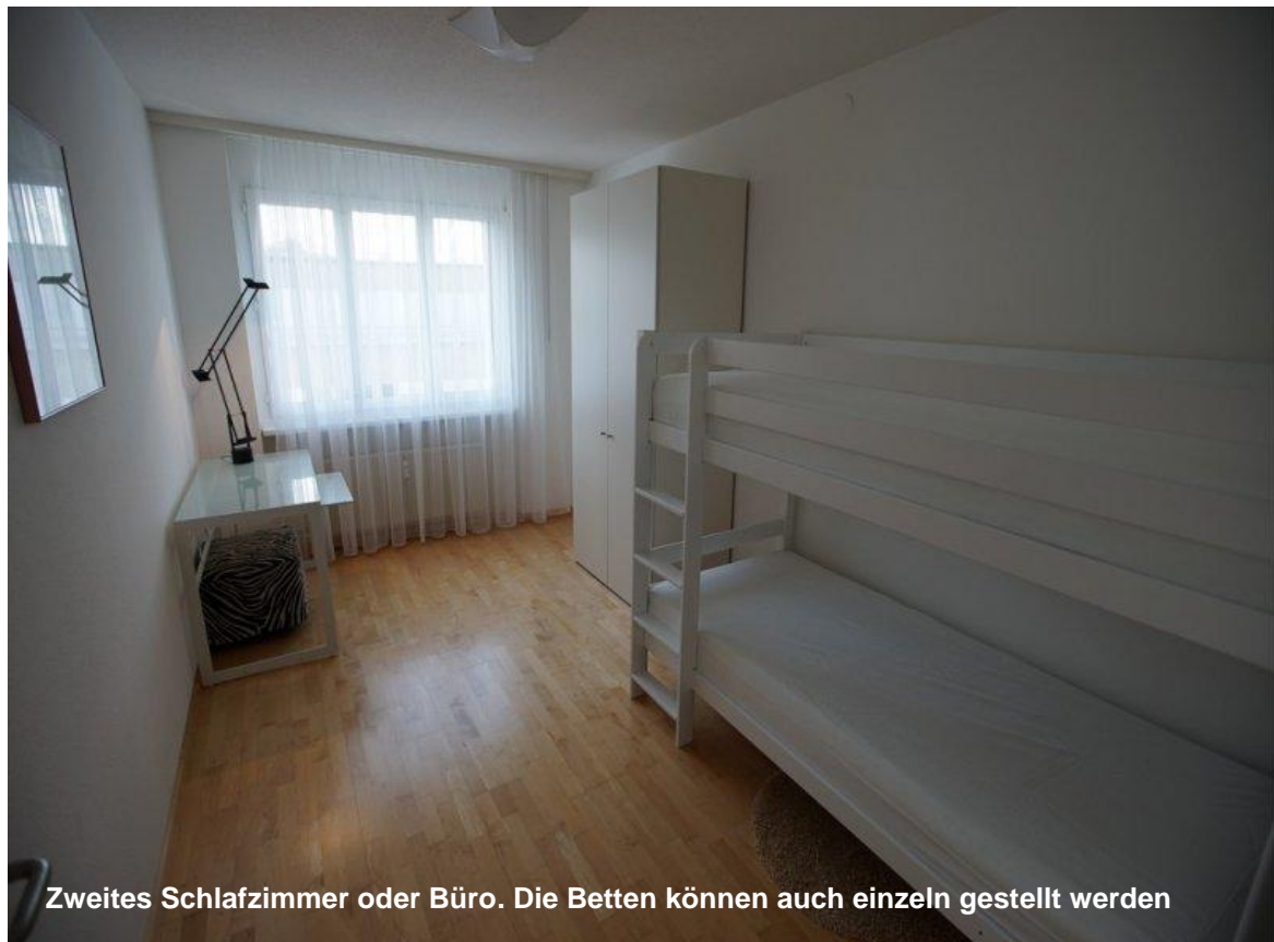
Zweites Schlafzimmer oder Büro. Die Betten können auch einzeln gestellt werden