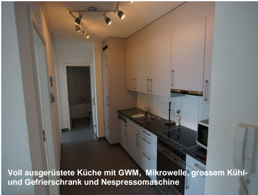
Voll ausgerüstete Küche mit GWM, Mikrowelle, grossem Kühl- und Gefrierschrank und Nespressomaschine