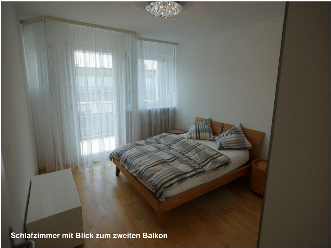
Schlafzimmer mit Blick zum zweiten Balkon