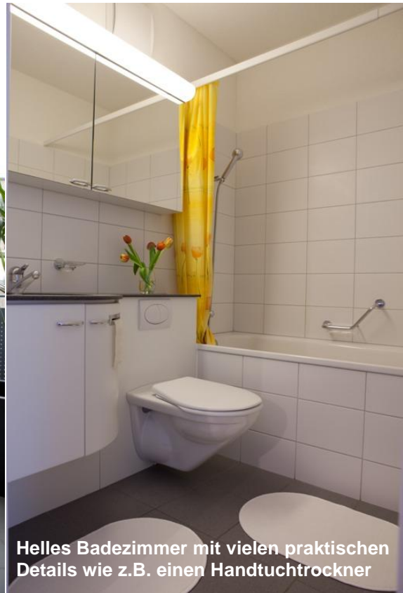
Helles Badezimmer mit vielen praktischen Details wie z.B. einen Handtuchtrockner