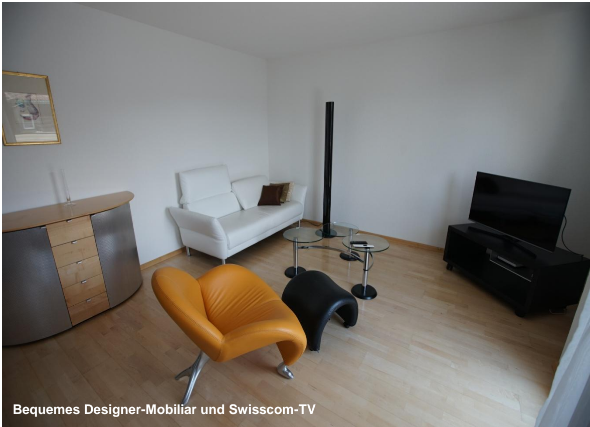
Bequemes Designer-Mobiliar und Swisscom-TV