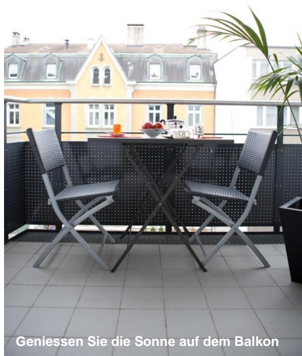
Geniessen Sie die Sonne auf dem Balkon