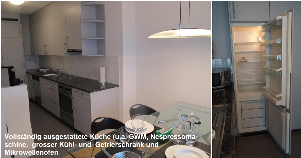
Vollständig ausgestattete Küche (u.a. GWM, Nespressomaschine, grosser Kühl- und Gefrierschrank und Mikrowellenofen)