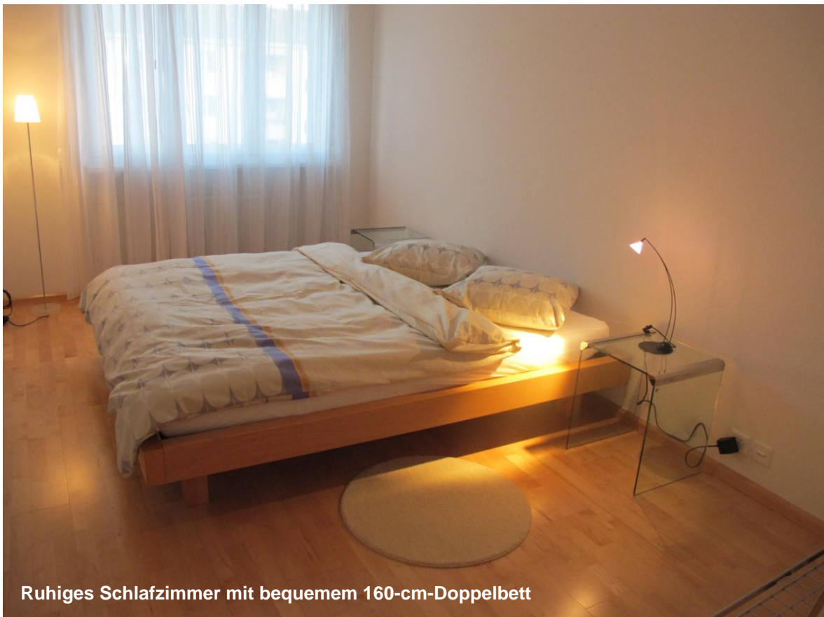
Ruhiges Schlafzimmer mit bequemem 160-cm-Doppelbett