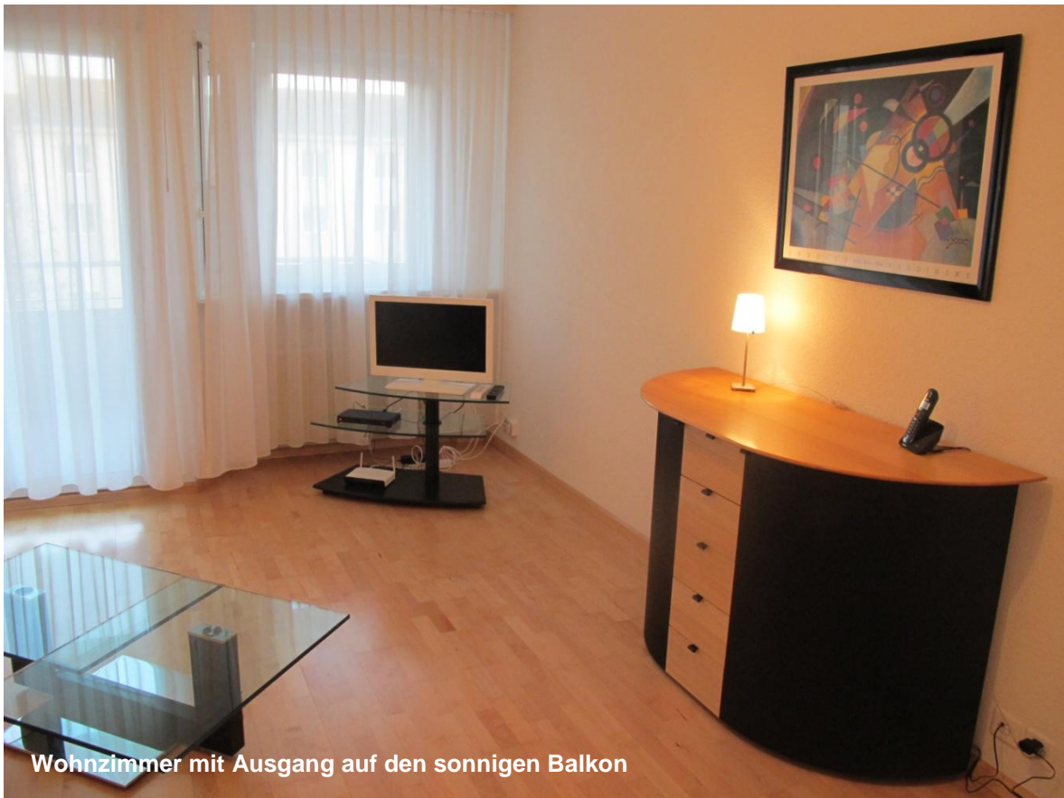
Wohnzimmer mit Ausgang auf den sonnigen Balkon