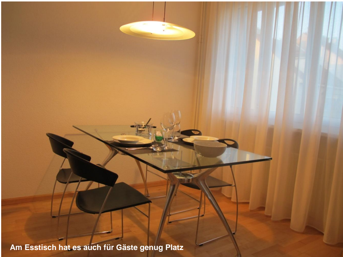
Am Esstisch hat es auch für Gäste genug Platz