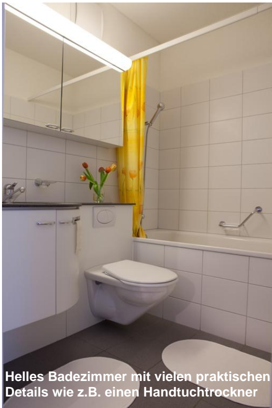
Helles Badezimmer mit vielen praktischen Details wie z.B. einen Handtuchtrockner