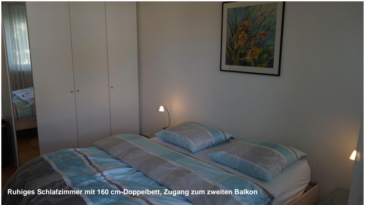
Ruhiges Schlafzimmer mit 160 cm-Doppelbett, Zugang zum zweiten Balkon