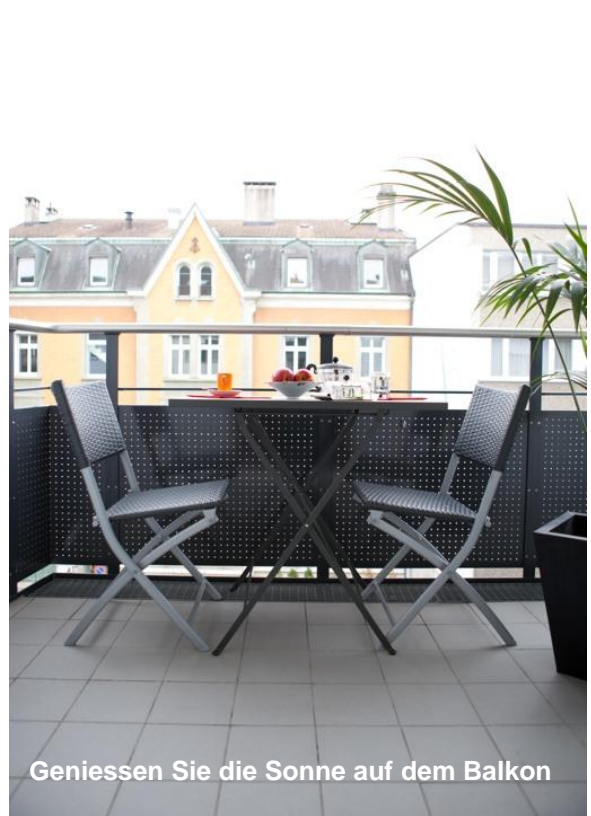
Geniessen Sie die Sonne auf dem Balkon