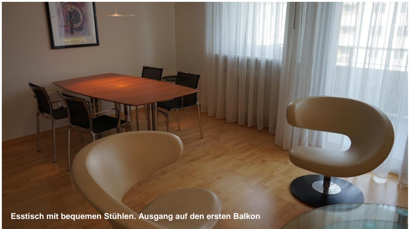
Esstisch mit bequemen Stühlen. Ausgang auf den ersten Balkon