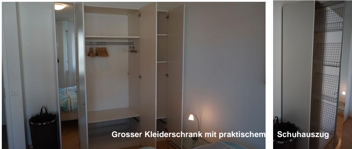
Grosser Kleiderschrank mit praktischem Schuhauszug