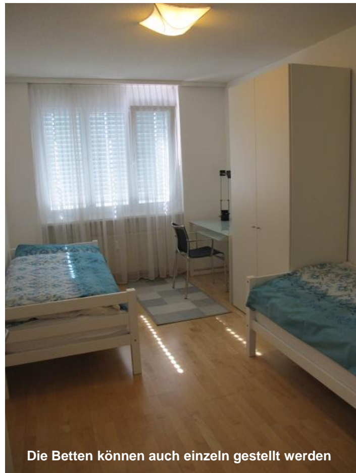
Die Betten können auch einzeln gestellt werden