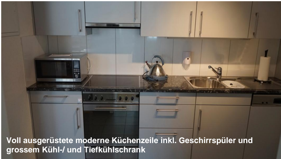
Voll ausgerüstete moderne Küchenzeile inkl. Geschirrspüler und grossem Kühl- und Tiefkühlschrank