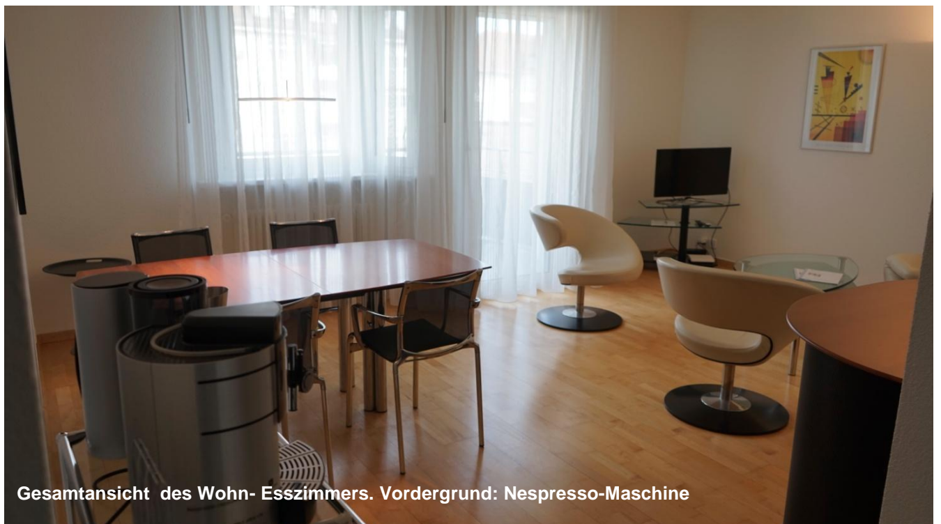
Gesamtansicht des Wohn- Esszimmers. Vordergrund: Nespresso-Maschine