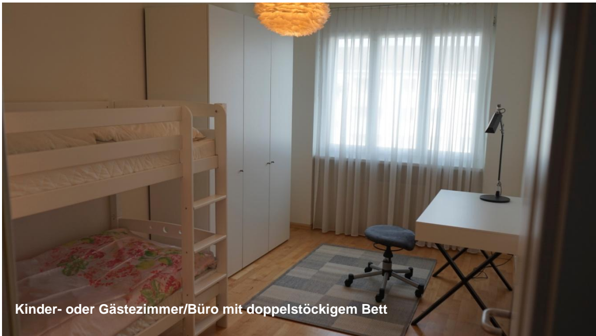
Kinder- oder Gästezimmer/Büro mit doppelstöckigem Bett