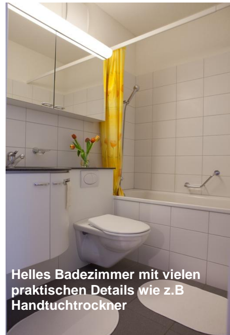
Helles Badezimmer mit vielen praktischen Details wie z.B Handtuchrockner