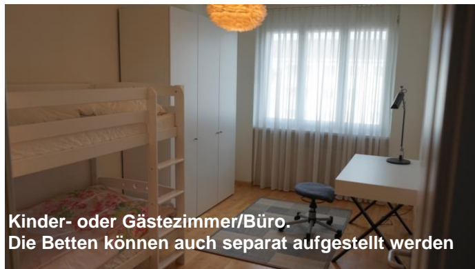
Kinder- oder Gästezimmer/Büro. Die Betten können auch separat aufgestellt werden