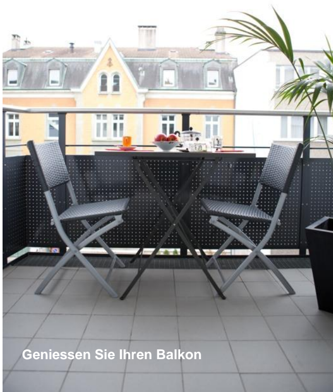
Geniessen Sie Ihren Balkon