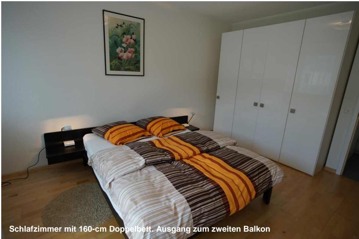
Schlafzimmer mit 160-cm Doppelbett. Ausgang zum zweiten Balkon