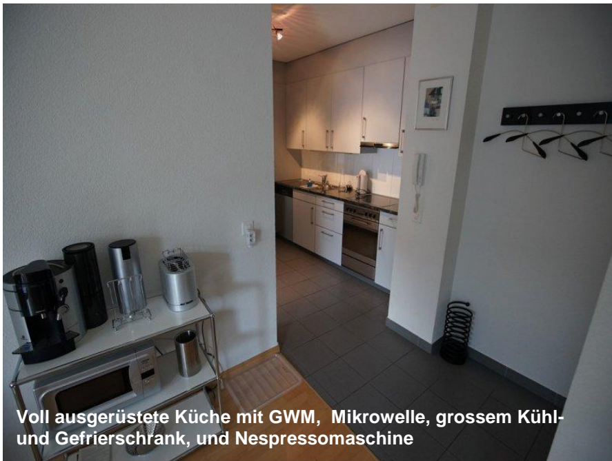
Voll ausgerüstete Küche mit GWM, Mikrowelle, grossem Kühl- und Gefrierschrank, und Nespressomaschine